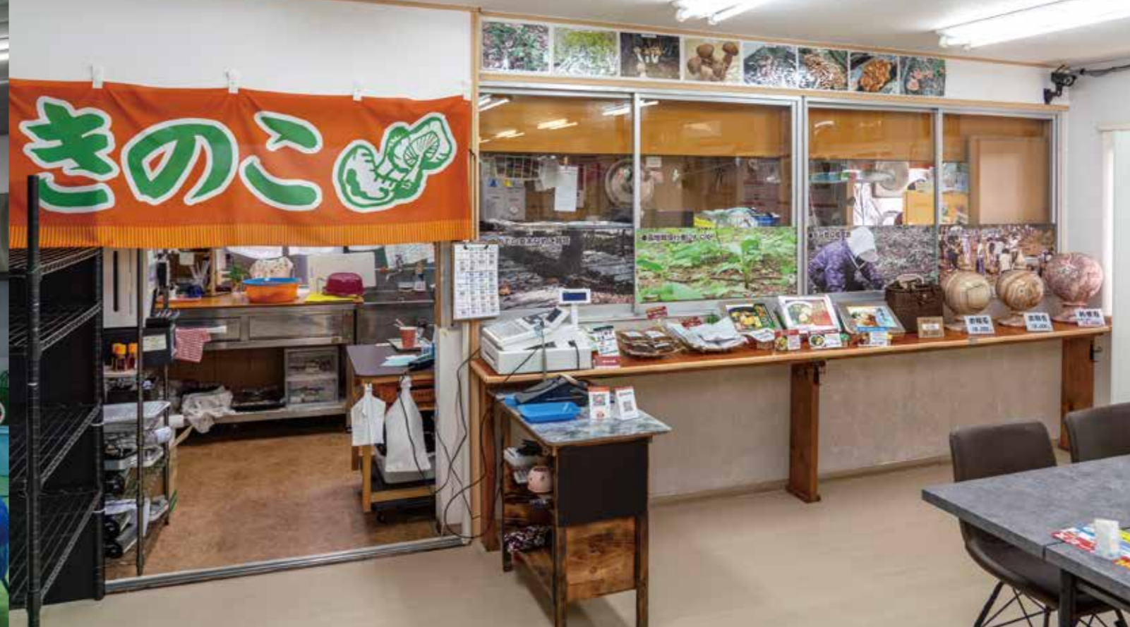
自社食堂「きのこの駅」。きのこをふんだんに使ったパスタや、ラーメン、鍋等の、料理を提供している。