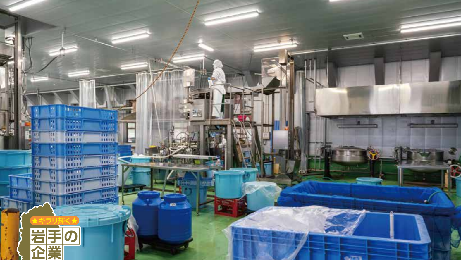
天然あみたけの加工場。中国から届いた塩蔵のあみたけを塩抜きする。