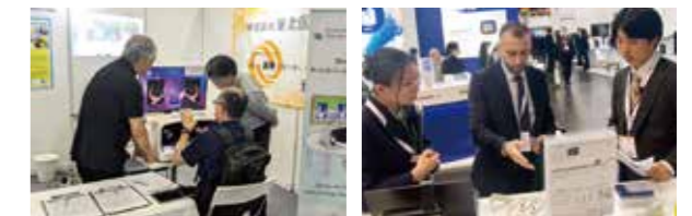
MEDICAL FAIR ASIA 2024

当センターでは、今後も県内企業の製品を海外にPRするための支援を実施してまいりますので、お気軽にお問い合わせください。